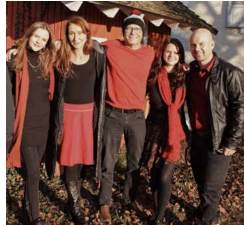
© Ensemble „All of us“ / Alina Lang (Fotografin)

Musik öffnet Herzen, hebt die Stimmung und vereint Menschen. Zum gemeinsamen Adventslieder singen mit dem erprobten Ensemble „All of us“ laden wir Sie herzlich ein. Traditionelle Weihnachtslieder begleitet von Gitarre lassen Sie in schönen Erinnerungen schwelgen und zaubern Lächeln auf die Gesichter. Auch für das leibliche Wohl in angenehmer Atmosphäre wird gesorgt.